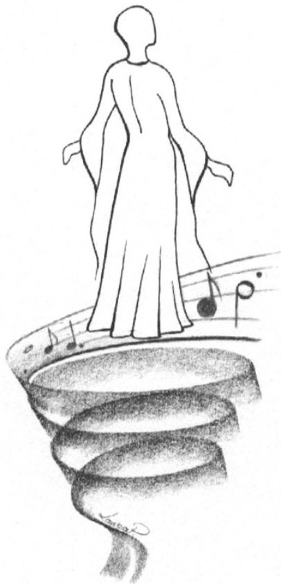
Disegno in frontespizio "Iniziato" 2002 Carboncino e china Formato A4